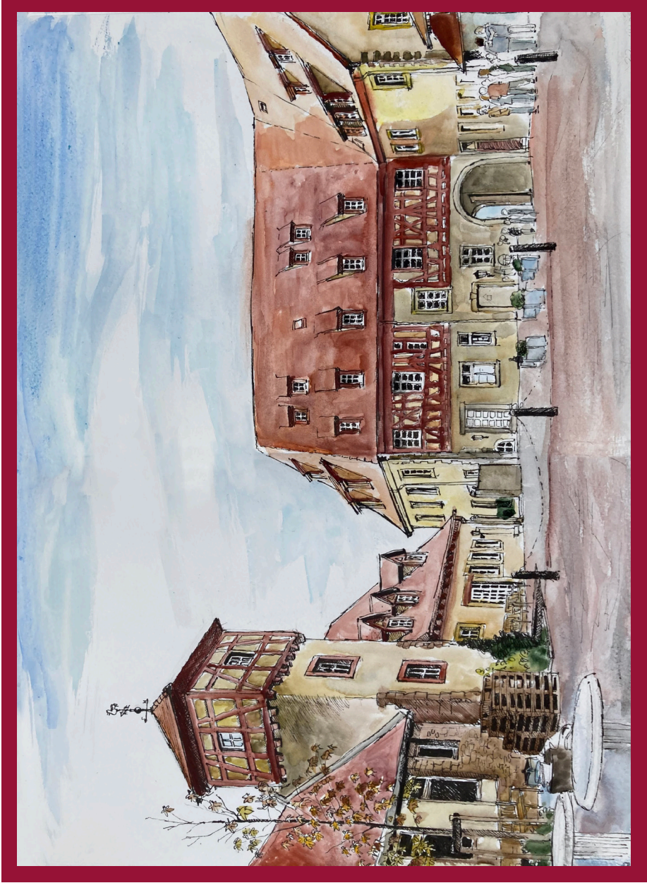
gezeichnet von Benjamin Fischer (aktuelles Jahresteam)